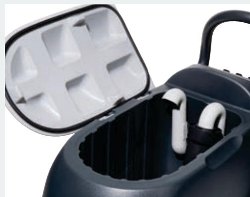
Бак для грязной воды большого объёма и съёмная крышка упрощают очистку и техническое обслуживание. Высокая скорость и гигиена.

Технические характеристики и данные могут быть изменены без предварительного уведомления.